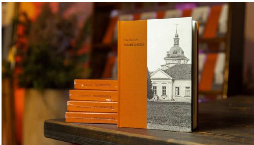
Grāmatas VALMIERMUIŽA izdošana un atklāšana