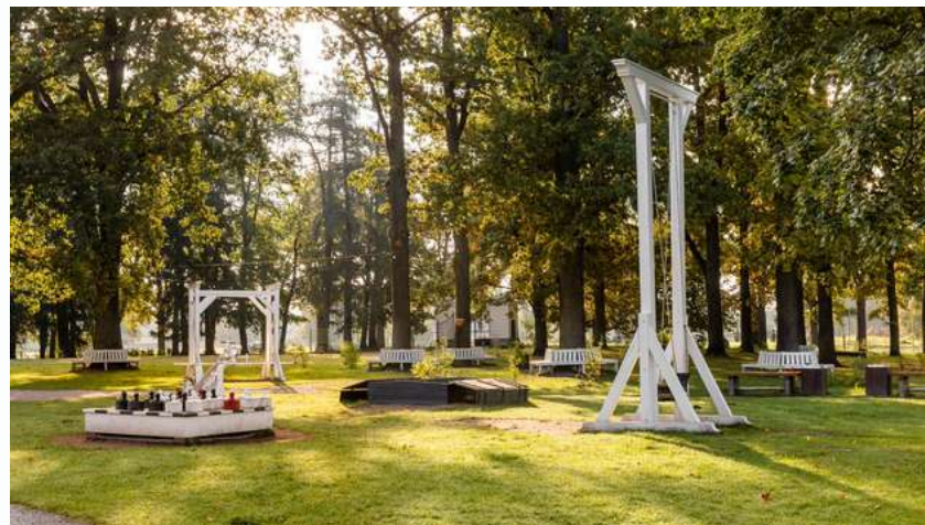
Infrastruktūras uzlabošanas darbi