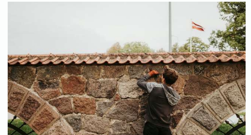
Kultūras mantojuma saglabāšana - žoga un klēts restaurācija